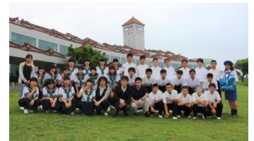
平和祈念公園では資料館の見学も