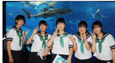
念願のじんべいざめに会えました

2日目は、糸数壕、平和祈念公園、ひめゆりの塔で平和学習をし、高速道路で本部まで行き、ちゅら海水族館を満喫しました。平和集会では、ガイドさんが、「今、みなさんが宣言してくれたことは、私達が伝えたいことそのものでした。」と、涙ぐむ場面もありました。